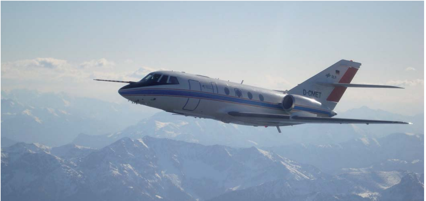
Weinzierl nutzt oft Messungen des DLR-Forschungsflugzeug Dassault Falcon 20E

Leonhard Scheck: Großwetterlagen lassen sich eine Woche im Voraus ganz gut prognostizieren. Wenn es aber im Sommer zu Gewittern kommt, kann man selbst Stunden vorher kaum sagen, wo genau und wie stark sie niedergehen werden. Je kleiner die Skalen, desto geringer ist die Vorhersagbarkeit. Das Gegenbeispiel sind Klimasimulationen: Da geht es um Statistiken auf größeren räumlichen und zeitlichen Skalen, zum Beispiel wie oft welche Großwetterlage auftritt und wie hoch die monatliche Durchschnittstemperatur ist. Die Vorhersagbarkeit dafür ist viel höher und die Änderung des Klimas kann daher über Jahrzehnte hinweg berechnet werden.